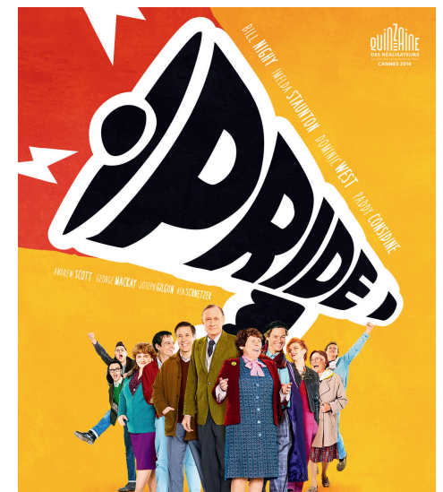
Ciné-rencontre Mercredi 01/07 à 20h