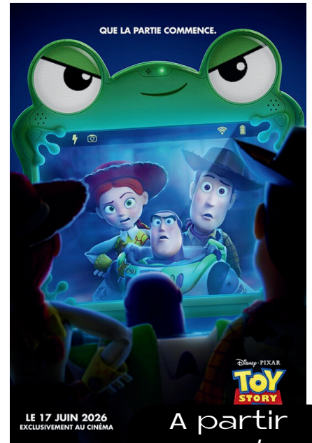
A partir du 17/06