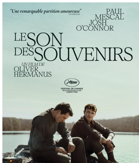
Film présenté par les Ambassadeur·rice·s vendredi 26/06 à 20h