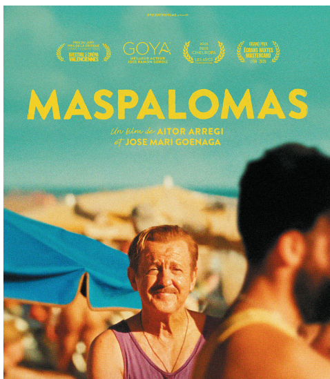
Avant-première + rencontre vendredi 19/06 à 20h